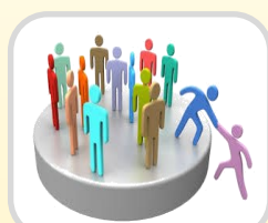
Interventi per l'inclusione scolastica, sociale e nello sport