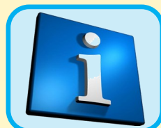
Informazioni sui servizi del territorio