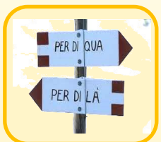
Orientamento scolastico e professionale