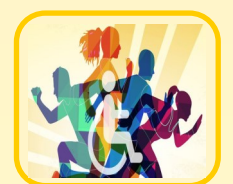
Percorsi di formazione e sensibilizzazione sui temi delle disabilità