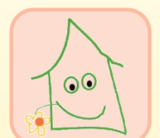
Laboratori e attività ludico-ricreative