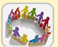
Gruppi di mutuo aiuto